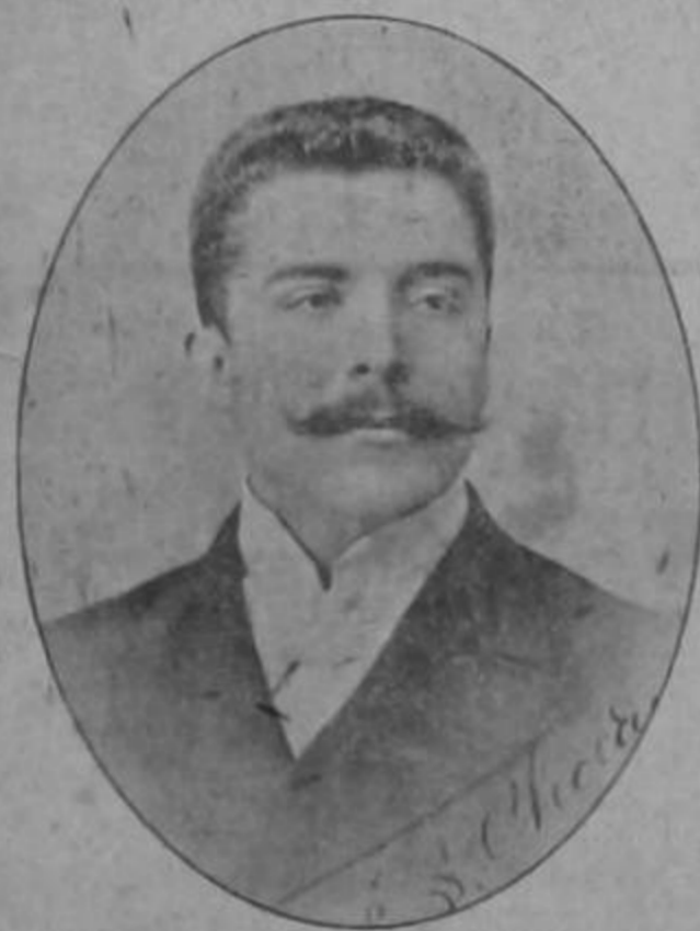
JOSÉ SANTOS CHOCANO